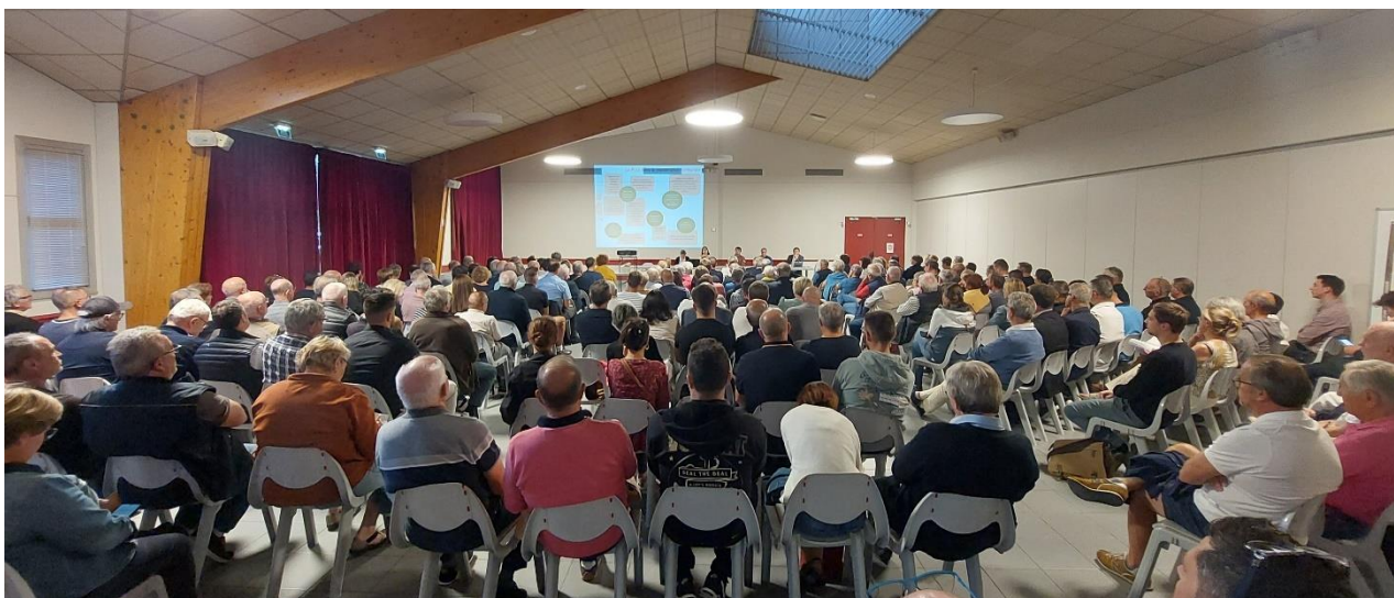
Réunion publique du 4 octobre 2023 à Challans

Chacune de ces réunions s'est conclue par un temps de questions-réponses avec la population. Il a également été rappelé que chacun pourra consulter le projet dans son intégralité et formuler des remarques lors de l'enquête publique.