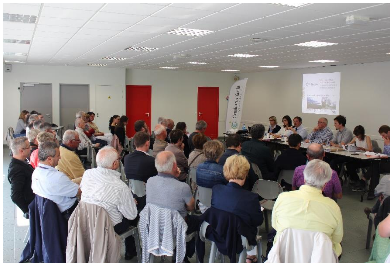
Réunion publique du 17 mai 2017 à Challans