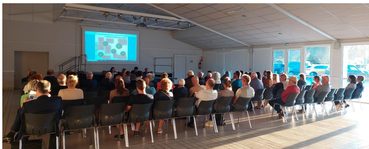
Réunion publique du 3 octobre 2023 à Beauvoir-sur-Mer

CHALLANS - Mercredi 4 octobre 2023 - 19h Salle Louis-Claude Roux - Salle B > 1 Rue des Plantes