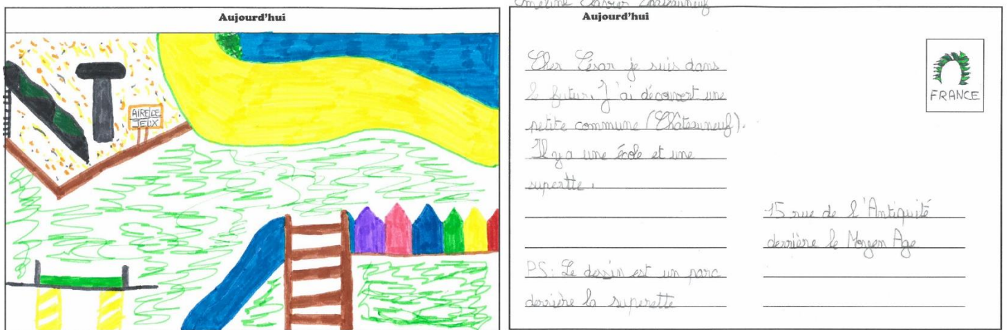
Atelier avec les enfants