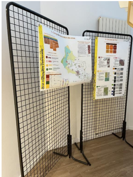
Exposition dans le hall d'accueil de la communauté de communes