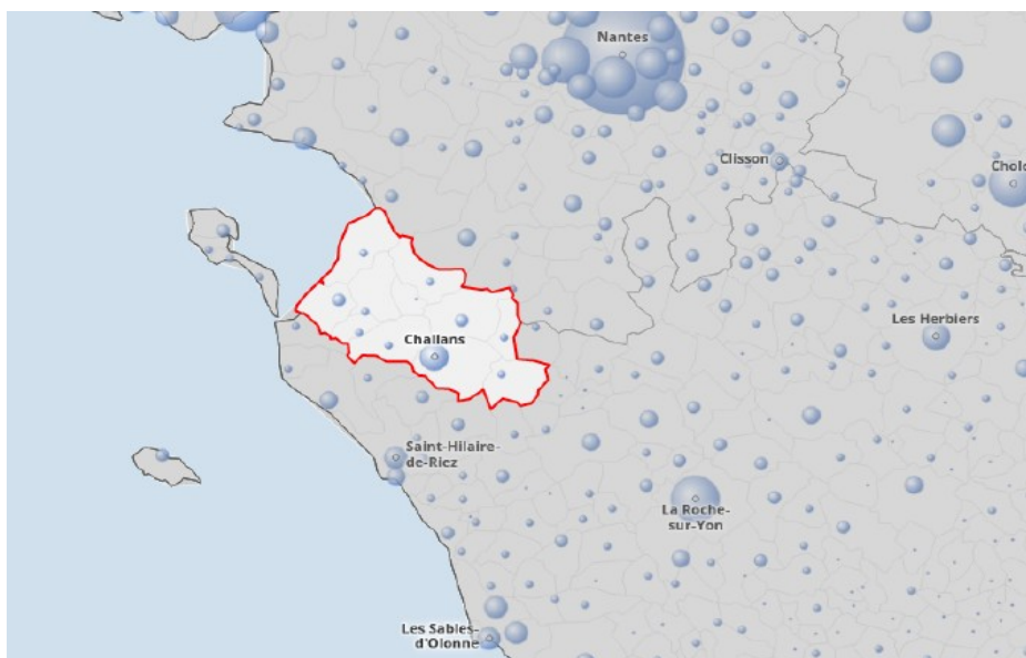
Carte de situation du territoire

Au paysage littoral, puis à celui des marais où l'activité agricole est principalement tournée vers l'élevage, succède un paysage de bocage plus ou moins dense à mesure que l'on s'avance à l'intérieur des terres où l'agriculture s'oriente vers la polyculture. Toutefois l'agriculture ne représente que 7 % des emplois du territoire. Par comparaison, l'industrie en concentre 14 %, loin derrière le secteur tertiaire avec 69 % ; les 10 % restant correspondant au secteur de la construction (source INSEE RP 2014).